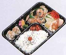
はっほうさい弁当(大) 930円