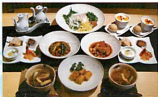
古門セット(大)2名様分イメージ

古門セット(大) (要予約) 3,500円 小前菜7品・鯛の中国風刺身・ふかひれ煮込みスープ1/2サイズ・杏仁豆腐・ごま団子