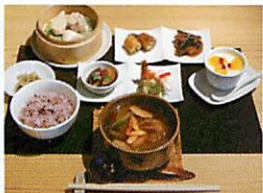
ふかひれお昼セット(大)

ふかひれお昼セット(大) 4,500円 前菜4品・点心3種・ふかひれ煮込みスープ・ご飯・ザーサイ・杏仁豆腐